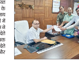
नारनौल। उपायुक्त को ज्ञापन सौंपते हुए एसोसिएशन सदस्य।

हरियाणा प्राइवेट स्कूल एसोसिएशन ने उपायुक्त को मुख्यमंत्री के नाम दिशानिर्देश पत्र