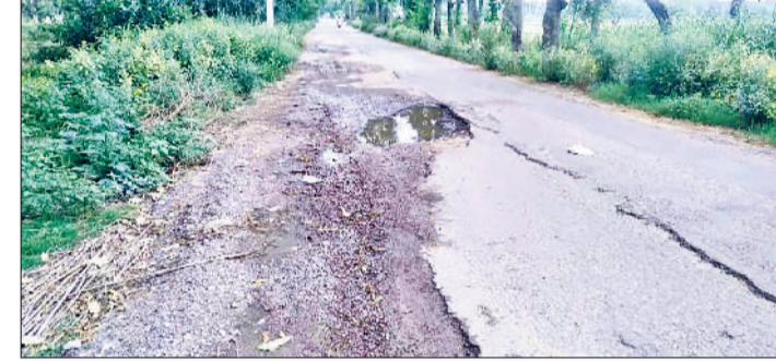
महेन्द्रगढ़। सड़क में बने गहरे गड्ढे।

मार्ग पर करीब एक दर्जन गांव आते हैं। लेकिन सड़क के चलते 50 हजार की आबादी को परेशानी उठानी पड़ रही है। महेन्द्रगढ़-अटेली मार्ग को एचएसआरडीसी द्वारा चौड़ा करके बनाया जाना है। करीब एक वर्ष पहले पीडब्ल्यूडी विभाग की ओर से यह सड़क एनएसआरडीसी को हेंडओवर की गई थी। वहीं इसके लिए राज्य सरकार ने 40 करोड़ रुपये की स्वीकृति मिल चुकी है। वहीं पिछले विभाग की ओर सड़क का निर्माण कार्य भी शुरू किया गया था। लेकिन सड़क की चौड़ाई बढ़ने के बाद बीच में वन विभाग की जमीन अडचन आ गई थी। जिससे चलते निर्माण कार्य शुरू नहीं हो पाया है। सड़क निर्माण कार्य शुरू नहीं होने के चलते एक करीब वर्ष से कई गांवों के लोगों को भारी परेशानी उठानी पड़ रही है। ग्रामीण पंचवर्क का कार्य शुरू कराने की मांग को लेकर प्रदर्शन भी कर चुके हैं।