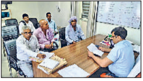
महेन्द्रगढ़। उपभोक्ताओं की शिकायत सुनते हुए।