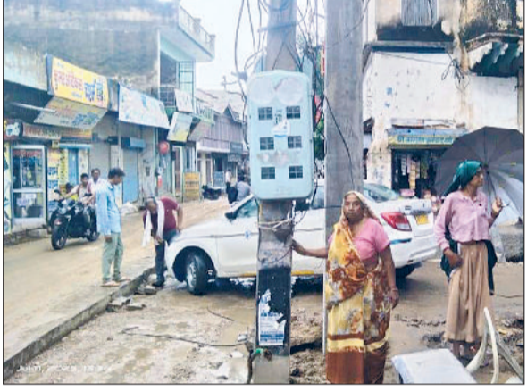
महेन्द्रगढ़। ठेकेदार द्वारा लगाए गए पुराने पोल के साथ नए पोल को दिखाती महिला।

11 हट्टा बाजार की सड़क पर 46 लाख की लागत से शिफ्ट होने हैं 48 बिजली के पोल, सड़क के बीचोंबीच लगे पोल के कारण बनी रहती है जाम की स्थिति